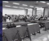
福山大学メディア・ 映像チーム(福山市)